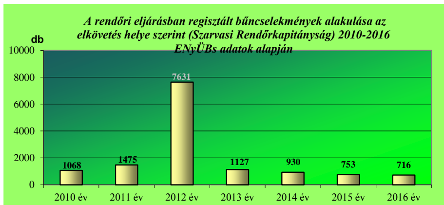
A rendőri eljárásban regisztrált bűncselekmények alakulása Ecsegfalva területén

A Szarvasi Rendőrkapitányság illetékességi területén 2016. évben összesen 716 bűncselekményt regisztráltak, ami az előző évi 753 esethez képest 4,9 %-os csökkenést jelent.