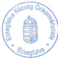
Bere Istvánné a bizottság elnöke