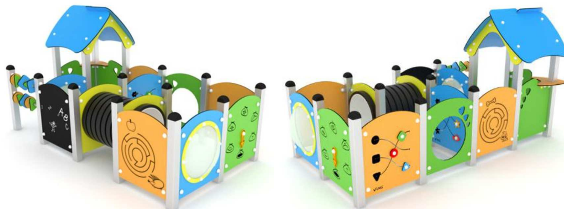
Vinci Play Labirintus mászóalagúttal, foglalkoztató panelekkel 108-2

Tartalmaz: 1db alagút 1db fedett kisház 1db kiadó pult 1db forgató játék 2db labirintus játék 2db ablak 1db érzelem-mutató játék 2db tili-toli játék